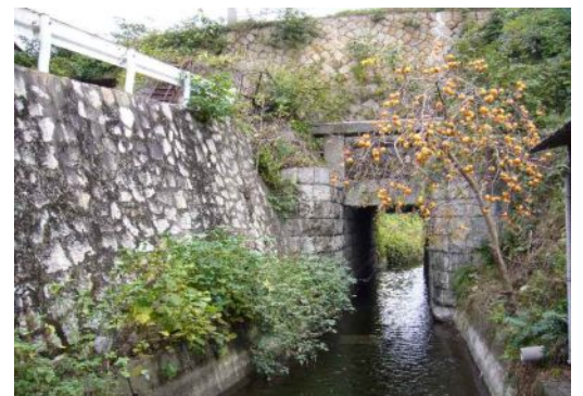
高瀬通し三の口水門(船穂町)

チボリ公園入場者は平成10年には318万人、平成19年には77万人にまで落ち込みました。チボリ公園が開園当時も他の観光地の観光客は減りつづけました。チボリ公園は開園から一路、入場者は減り続けましたが、平成14年、15年頃から市内主要観光地は微増に転じているのです。つまり、チボリ公園の入場者は、他の観光地への波及効果は示めされなかったのです。今後の街づくりに生かしたいものです。